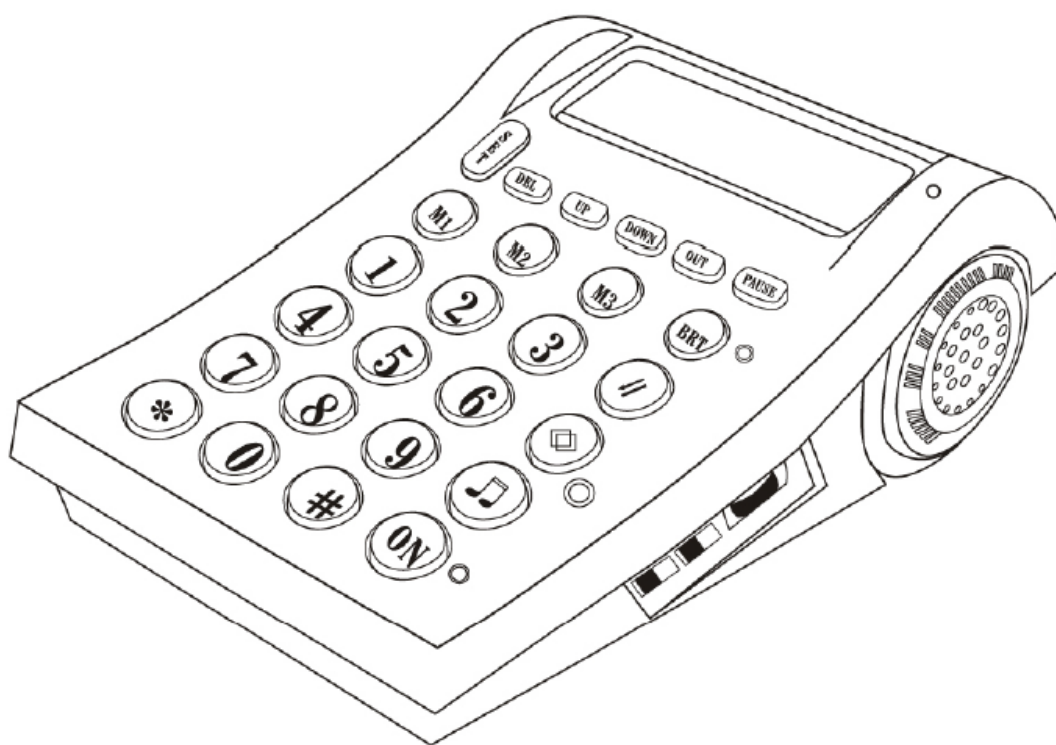
CDX-303 Fejbeszélős telefonkészülék